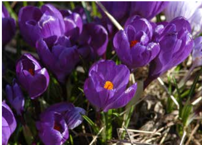
Några av vårens färger.